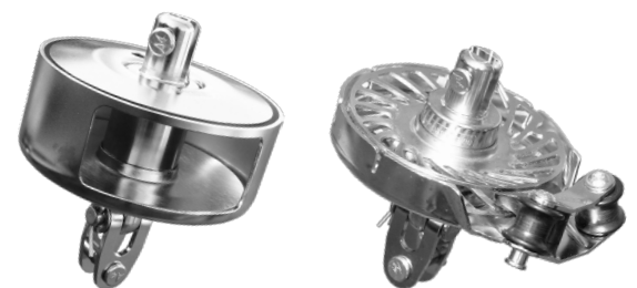
Abbildung zeigt Baugröße II